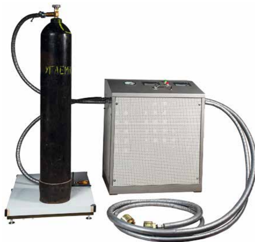
Станция зарядная углекислотная СЗУ-500 и СЗУ-500Д.

Станция зарядная углекислотная СЗУ-500 предназначена для: контроля массы баллонов, подлежащих заполнению, наполнения баллонов жидкой двуокисью углерода (CO 2 ) с весовым дозированием, наполнения углекислотой баллонов систем пожаротушения и огнетушителей, наполнения углекислотных моноблоков на 6...12 баллонов с весовым дозированием (весы под моноблоки поставляются по дополнительному заказу).